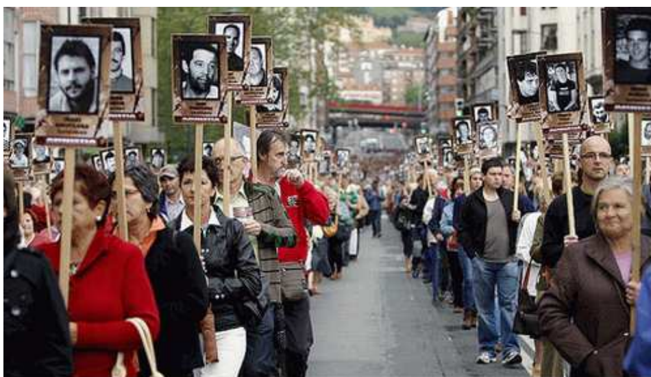
17. Mai 2008: mehr als 16.000 Menschen demonstrieren in Bilbao ihre Solidarität mit den 27 Angeklagten im Prozess gegen die Pro Amnestia Bewegung

Dass dieser Prozess in Europa möglich ist, ist zutiefst beunruhigend. Die spanische Regierung wird mit ihren „Hämmern gegen Ketzer“ den Konflikt im Baskenland nicht lösen. Das geht nur im Dialog mit all denen, denen sie gerade die Stimme zu verbieten sucht.